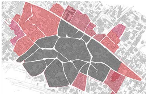
evoluzione storica Piano Particolareggiato