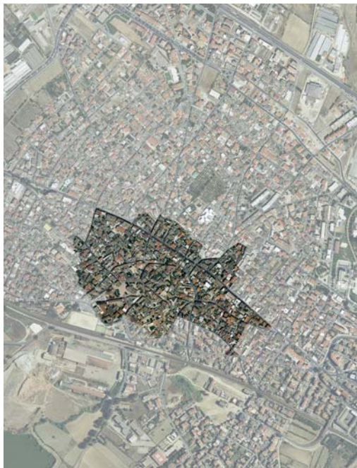
individuazione del centro matrice