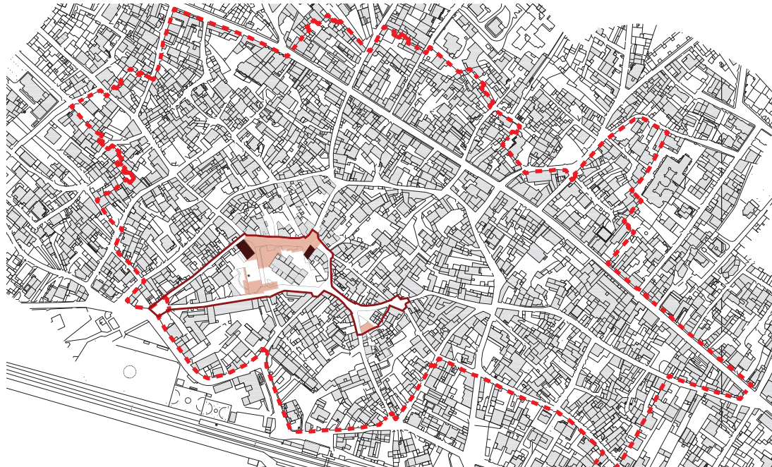
individuazione del centro matrice e dell'area di intervento